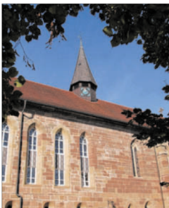
Die Klosterkirche Gnadental.

Michelfeld. Zu „Gebet und Stille“ wird für Sonntag, 31. Juli, in die Klosterkirche Gnadental eingeladen. Beginn ist um 19 Uhr. Bei dem Abendgebet in klösterlicher Tradition, das eine knappe halbe Stunde dauert, wechseln sich Lieder, Lesungen, Gebet, gesungene Psalmen und Momente der Stille ab. Sie laden dazu ein, den Sonntag in Ruhe zu beschließen. Das nächste „Gebet und Stille“ ist für den 28. August geplant.